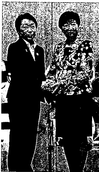
握手を交わす橋本五輪相(左)と小池知事(17日、都庁で)

で被害への対応に追われていることから、寄付金の受け付け業務を代理で行うこととした。市のホームページに、ふるさと納税の仲介サイト「ふるさとチョイス」へのリンクを設置。同サイトを通じて行われた寄付について、